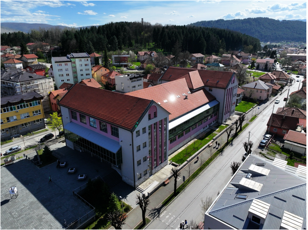
Приказ бочне (десне) и предње стране Дом културе