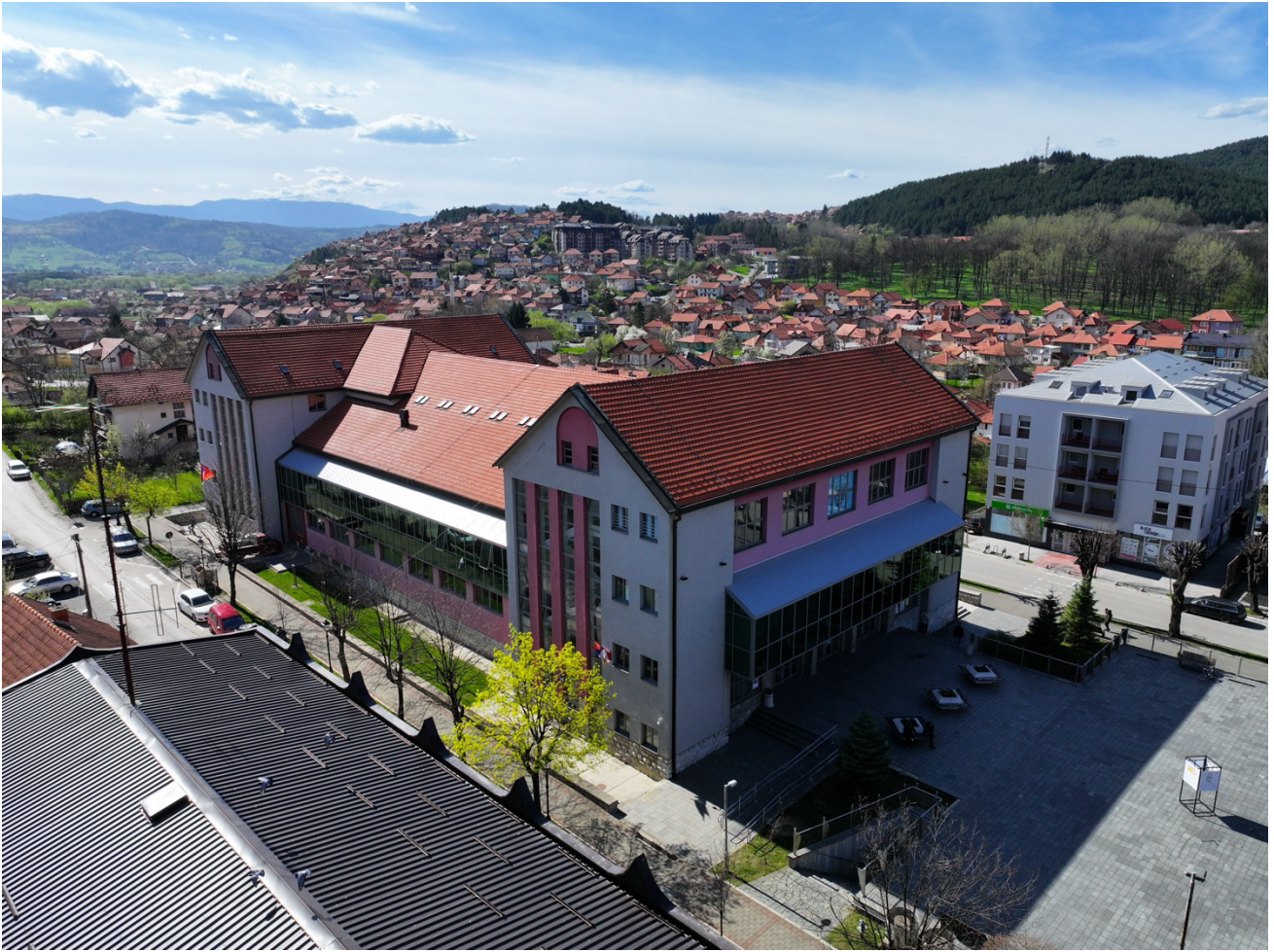
Приказ бочне (лијеве) и предње стране Дом културе