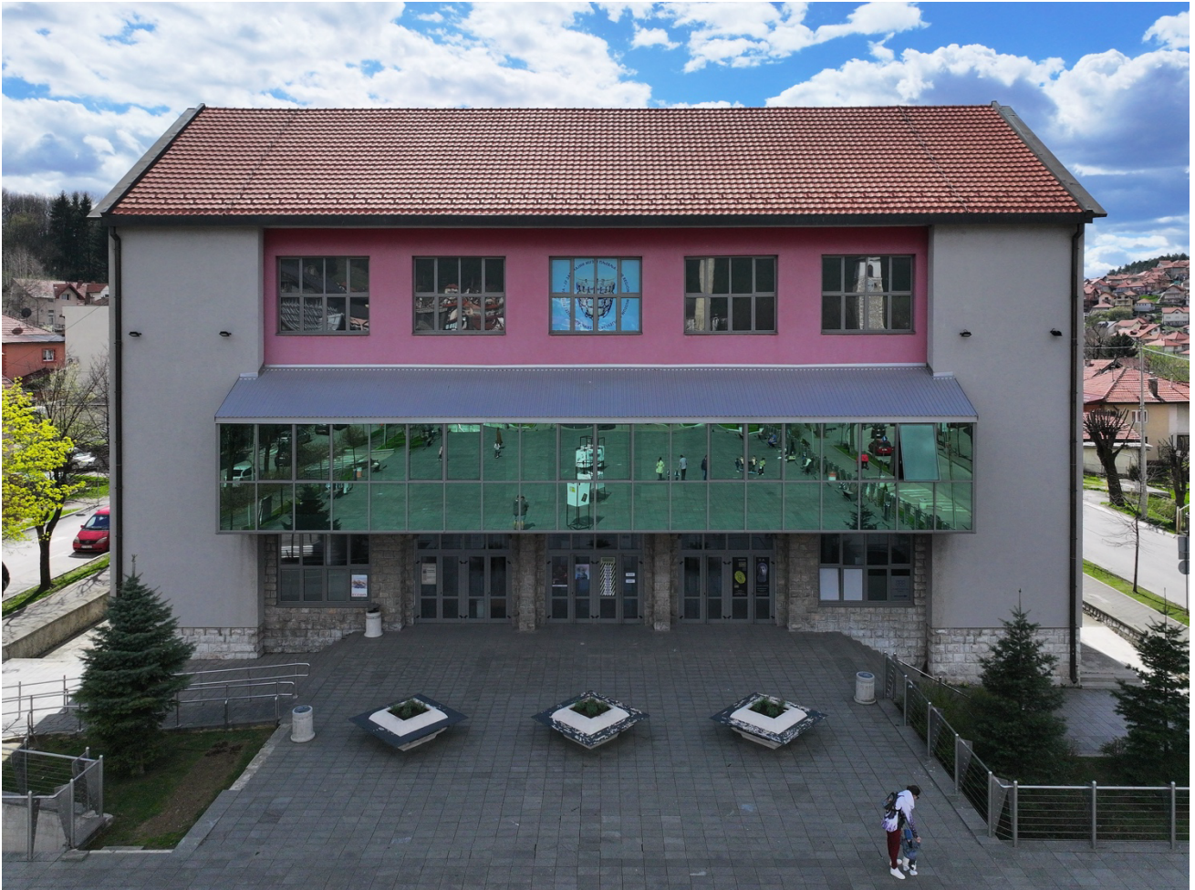
Предња страна Дома културе