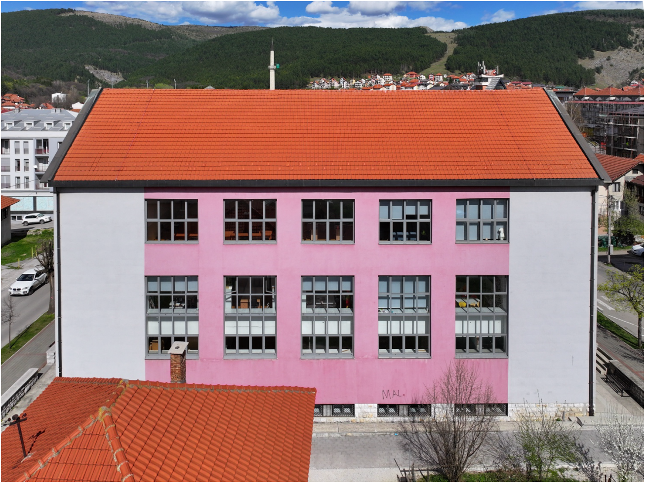
Задња страна Дома културе