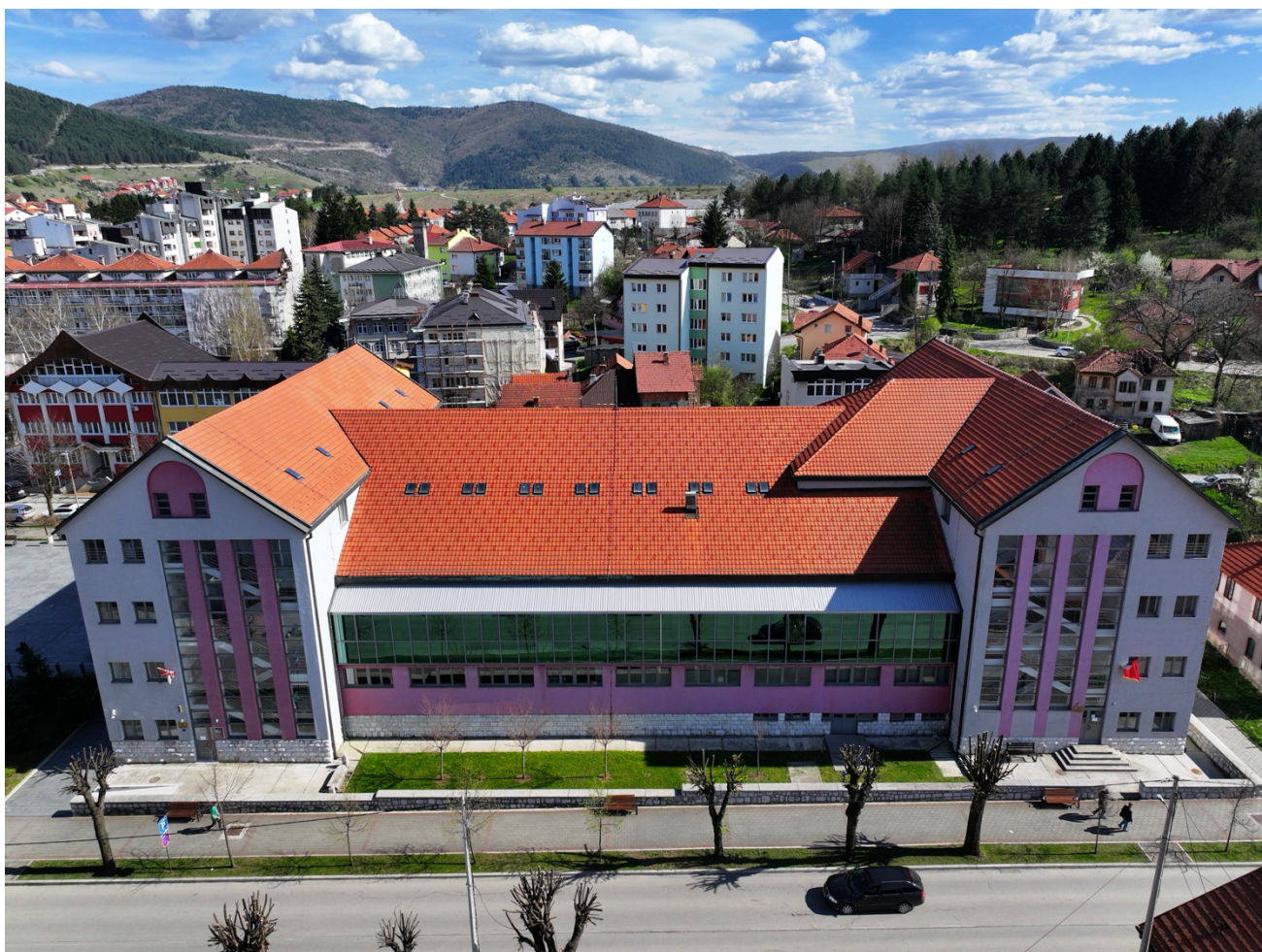
Приказ бочне (десне) стране Дом културе