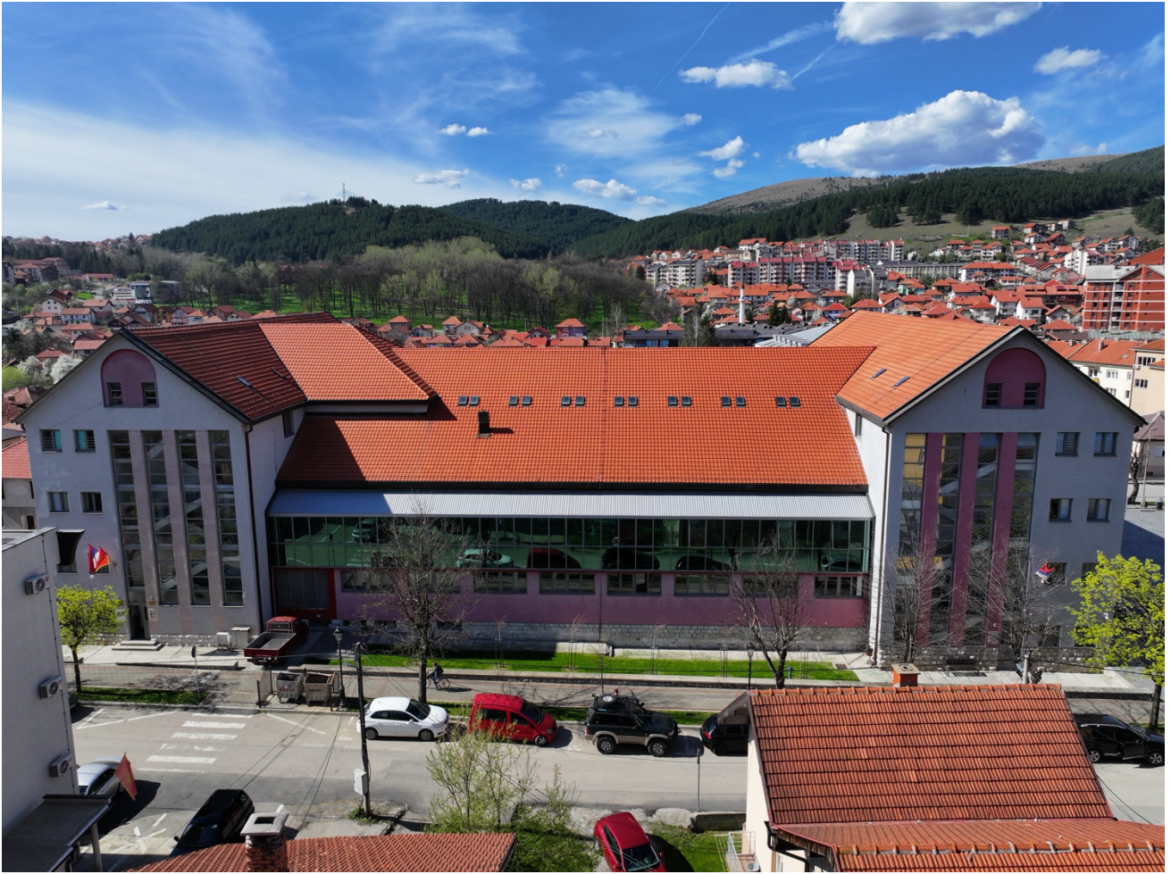
Приказ бочне (лијево) стране Дом културе