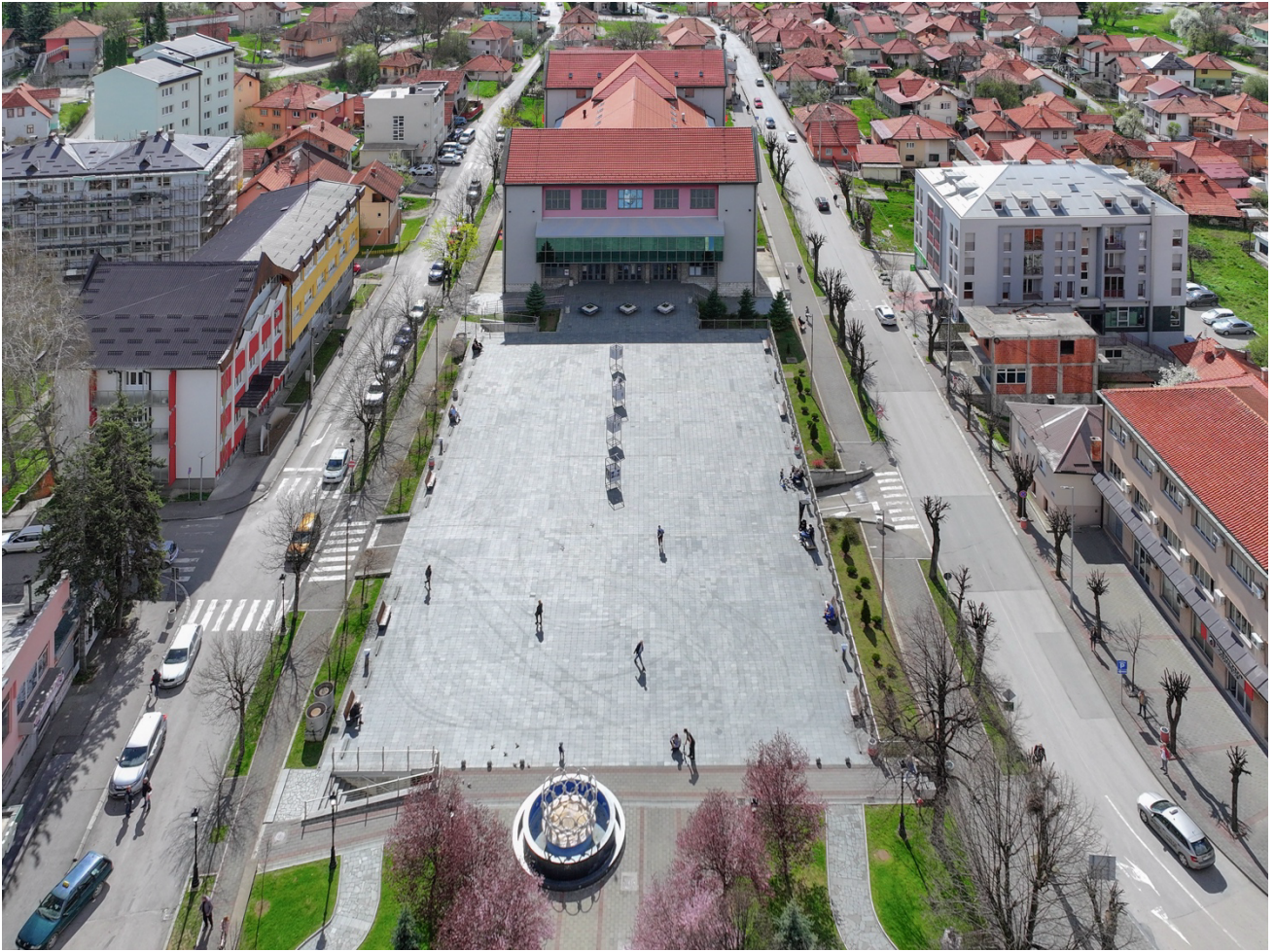
Фронтални изглед Трг 13. јул и Дом културе