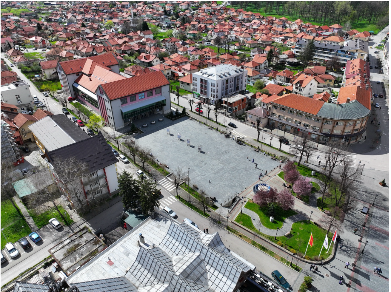
Бочни изглед (лијева страна) Трг 13. јул и Дом културе