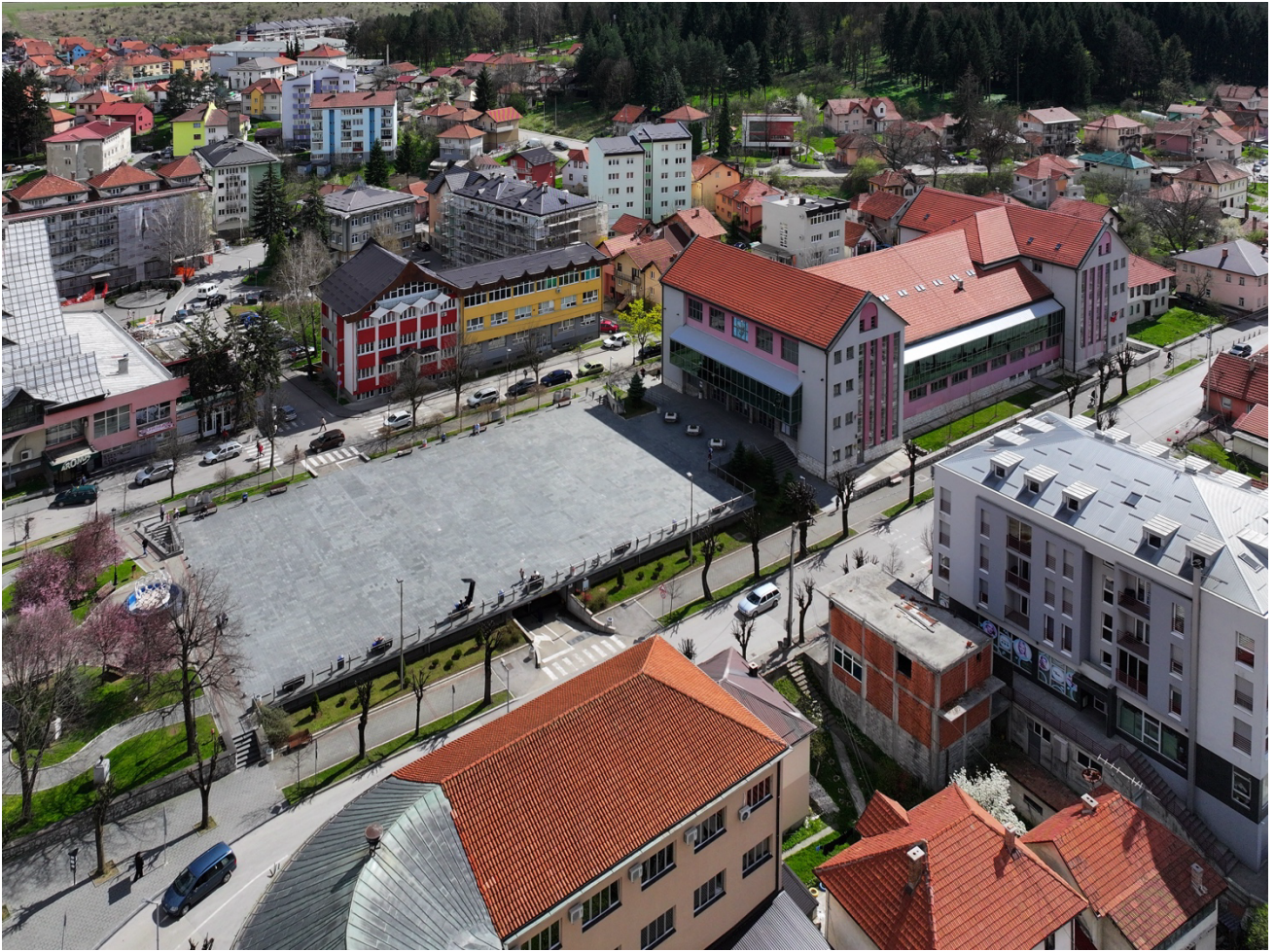
Бочни изглед (десна страна) Трг 13. јул и Дом културе