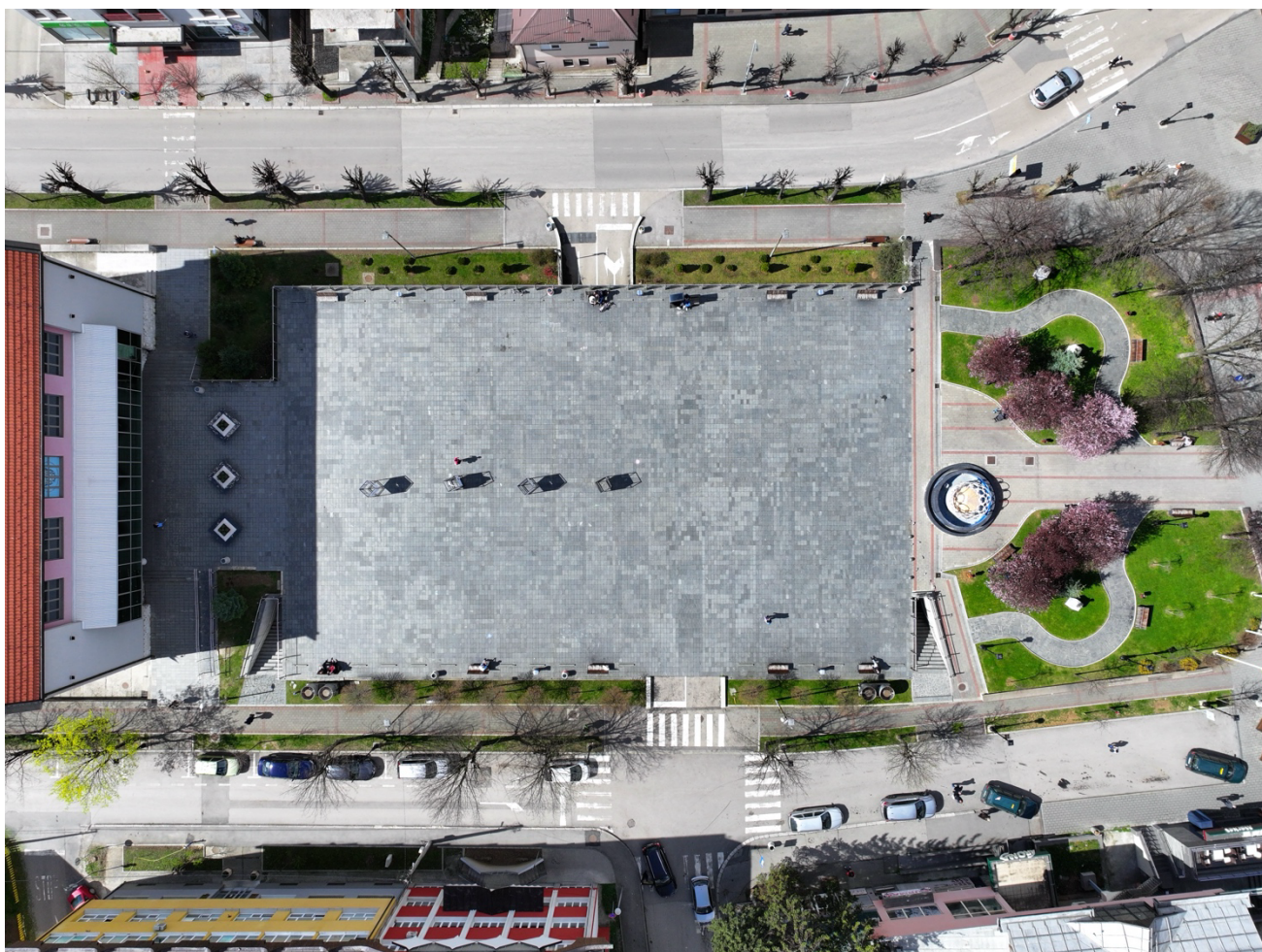
Приказ одозго Трг 13. јул