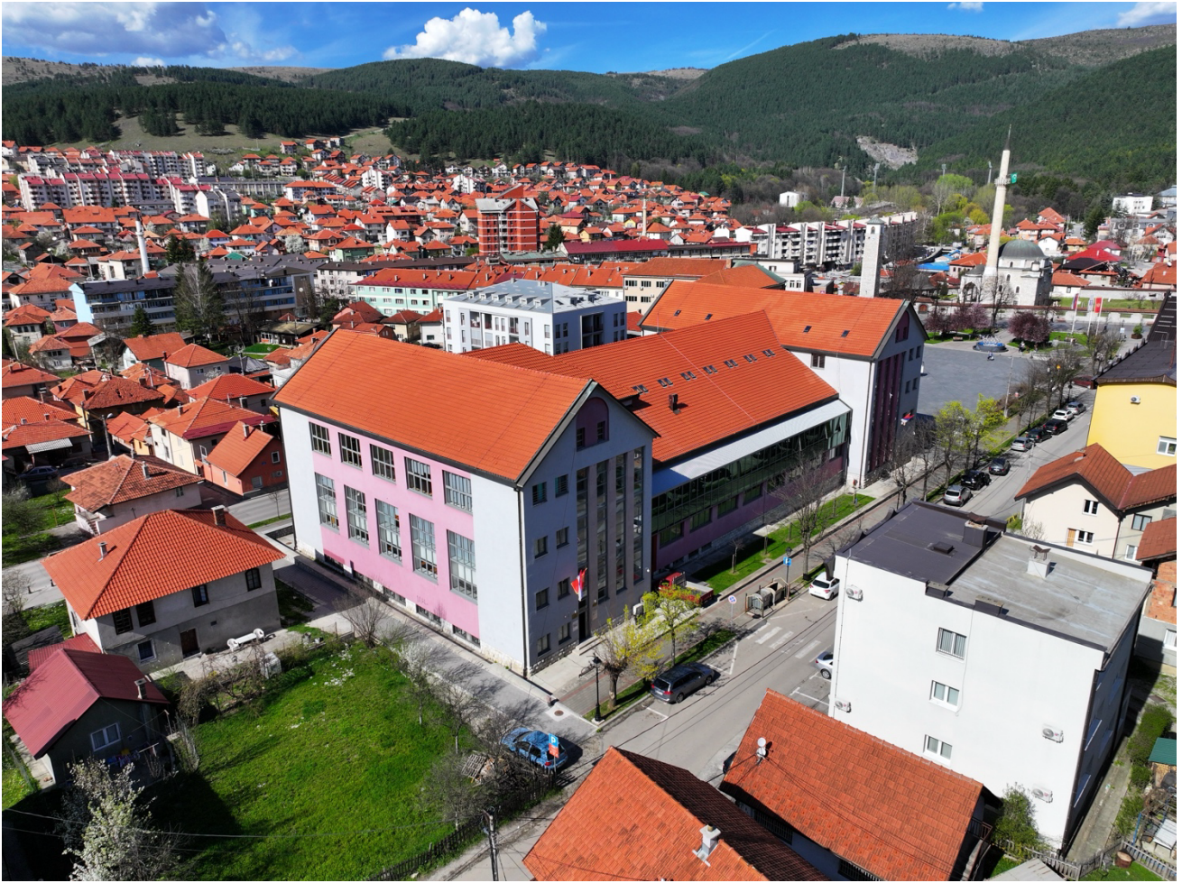
Приказ бочне (лијеве) и задње стране Дом културе