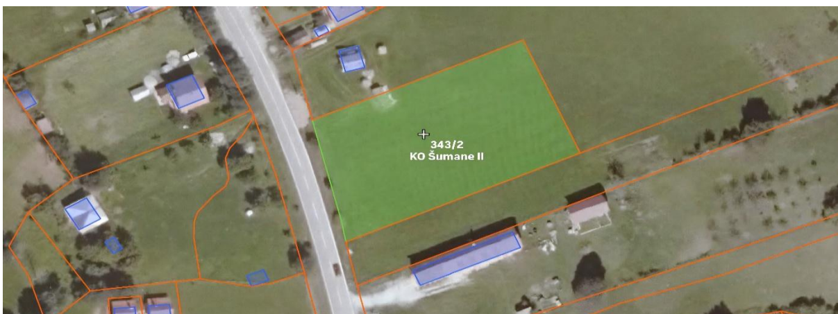
Slika 2. Lokacija objekata sa užom okolinom